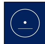
Kurzer oder langer Vokal