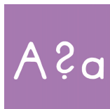
Groß- und Kleinschreibung